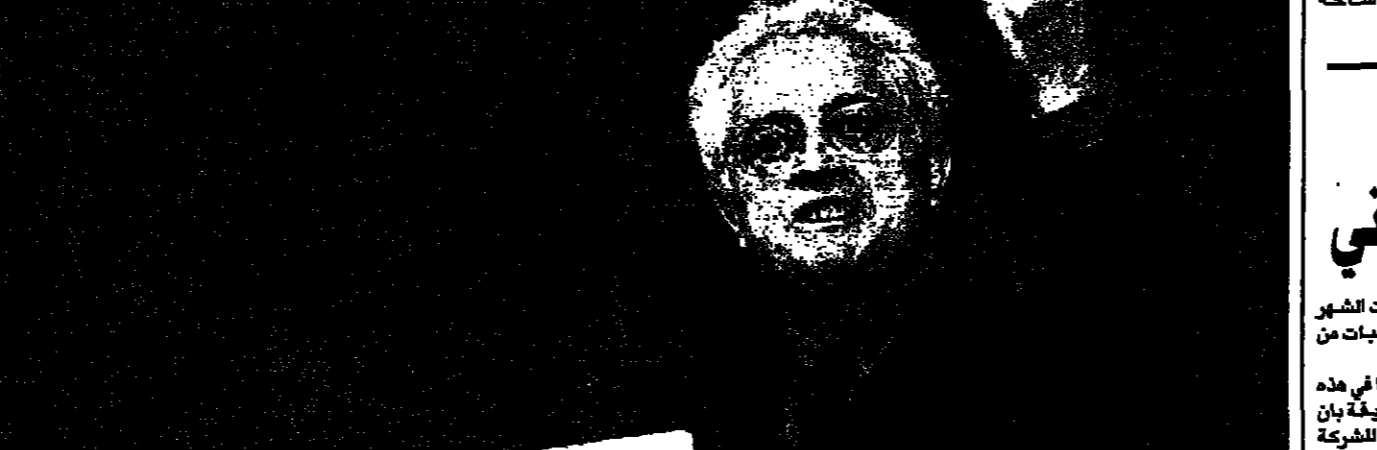
رئيس الوزراء الفرنسي ايريل جوسبان لدى القائه خطاباً امس امام مؤتمر الحزب الاشتراكي الفرنسي

■ بريس (فرنسا) - اف بى: اختتم الحزب الاشتراكي الفرنسي ظهر امس مؤتمره الاول منذ عودته الى السلطة في نيسان (ابريل) الماضي. وقد تم الكشف عن تفاصيل المؤتمر في بريس. وقد تم الكشف عن تفاصيل المؤتمر في بريس.